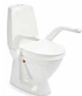
My-Loo met armsteunen 6 cm