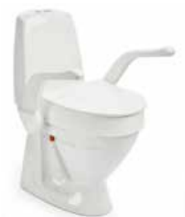
My-Loo met armsteunen 10 cm