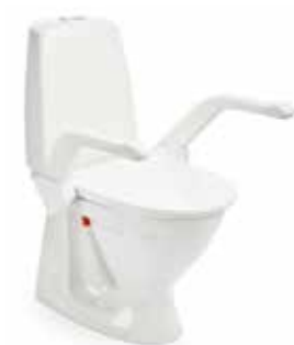
My-Loo met armsteunen 2 cm

De gladde oppervlakten zijn eenvoudig af te nemen met een zachte doek. Verwijder de zitting gemakkelijk uit de beugels wanneer deze apart van de armsteun gereinigd dienen te worden. Eenvoudig weer terug te klikken na reinigen.