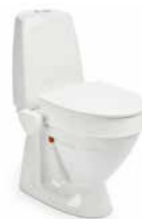
My-Loo 10 cm