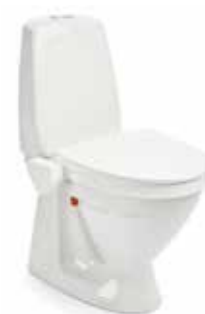
My-Loo 6 cm