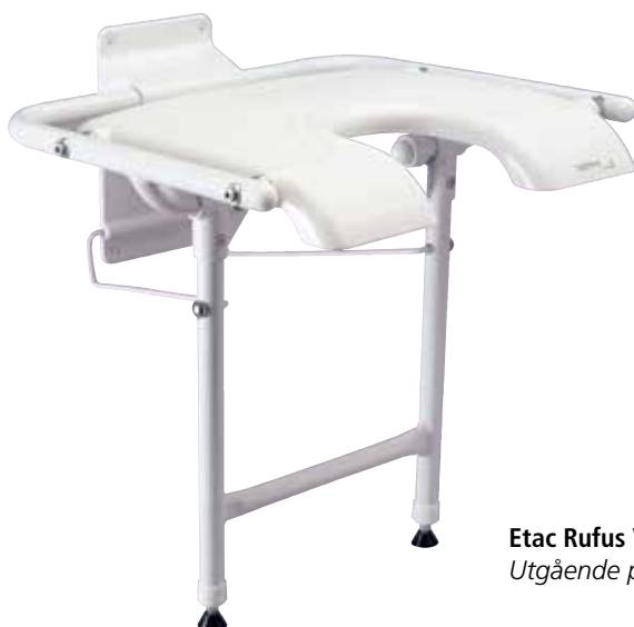
Etac Rufus Vägghmonterad duschpall Utgående produkt