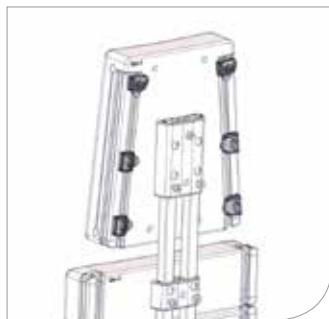
Fix lock monterade på Caribou