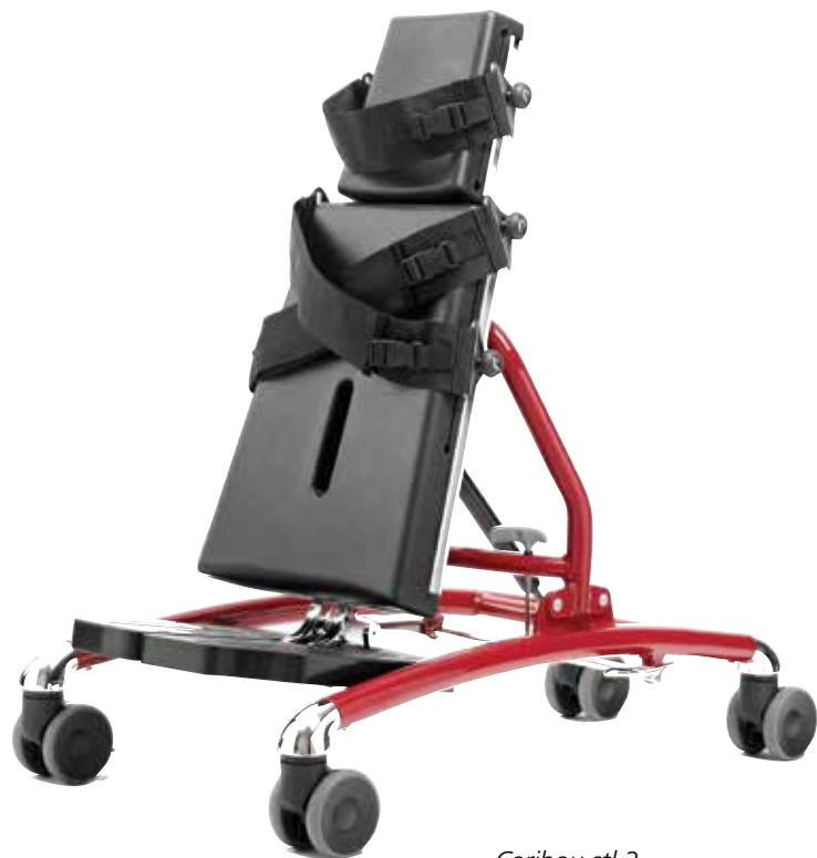
Caribou stl 2