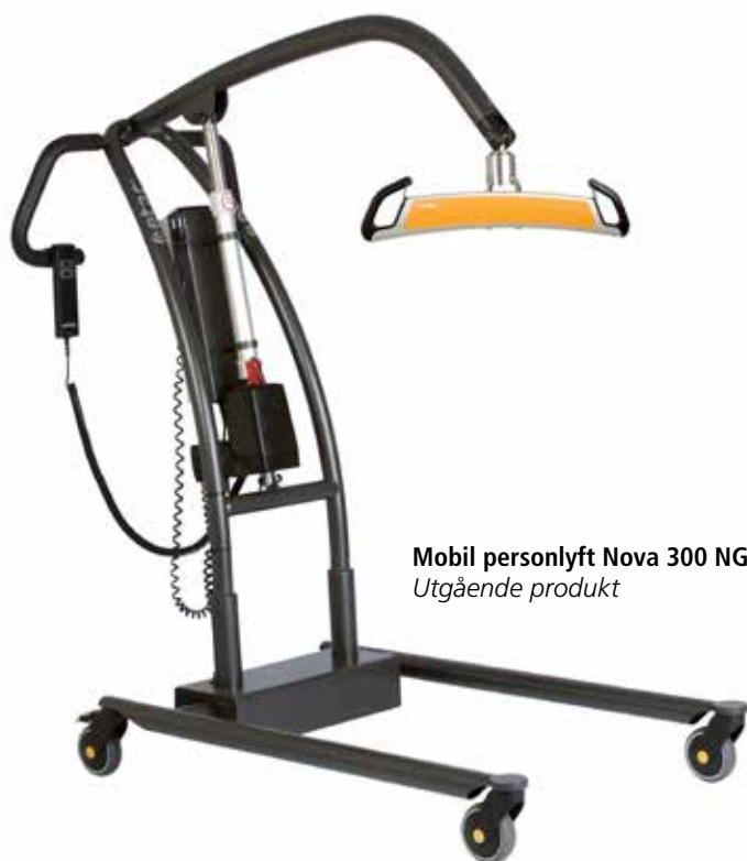
Mobil personlyft Nova 300 NG Utgående produkt

Vi använder tillfället att betona att upprensingslyft Nova 500NG kommer att fortsätta som vanligt och påverkas inte av att Nova 300NG utgår.